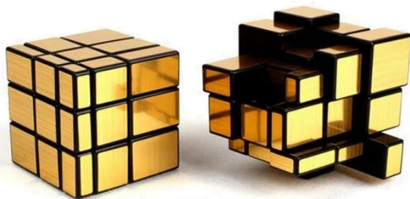
روبیك آینه ای